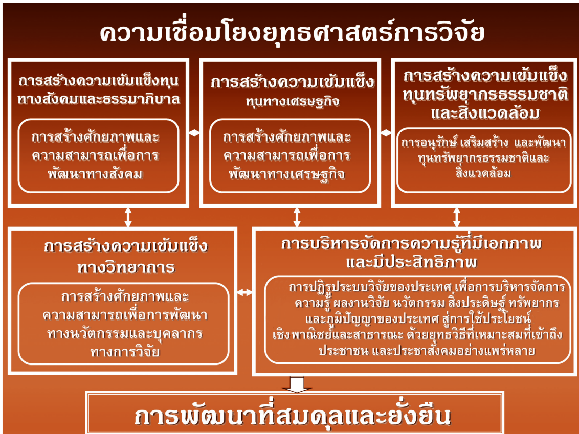
ภาพที่ 3 ความเชื่อมโยงยุทธศาสตร์การวิจัยของชาติสู่เป้าหมายการพัฒนาที่สมดุลและยั่งยืน